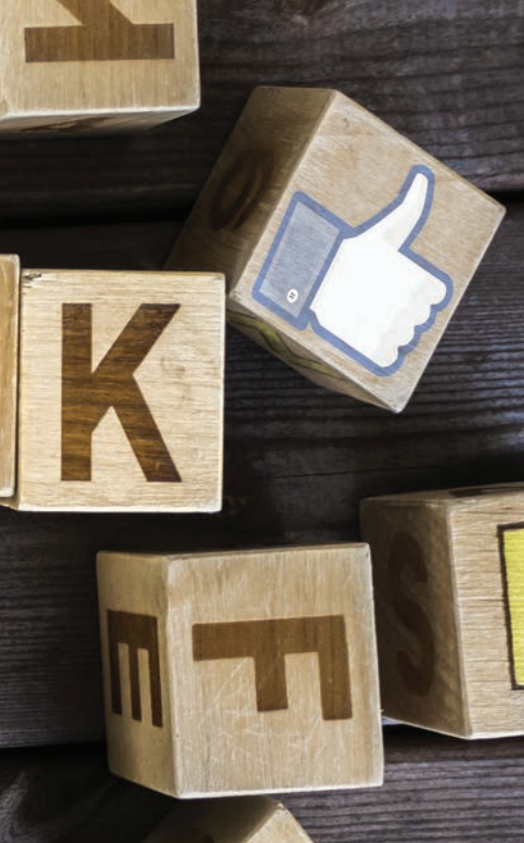
Essa Ruita por Pixabay